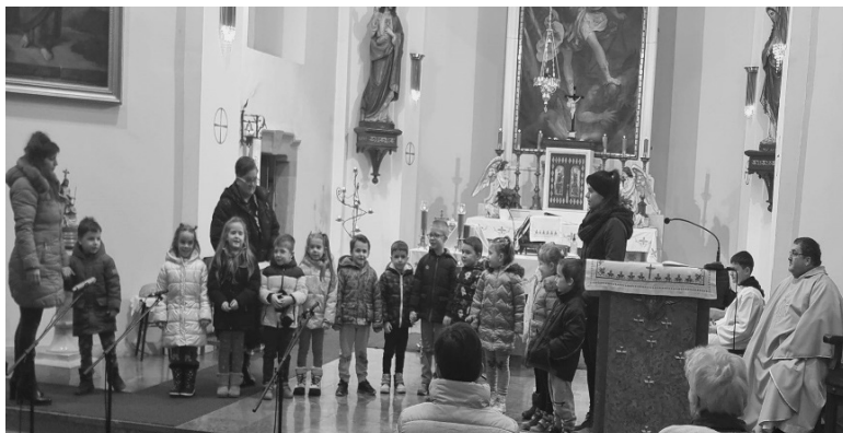
Maros utcai óvoda