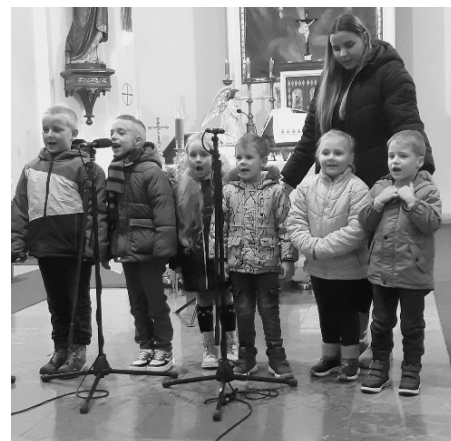
Rákóczi utcai óvoda