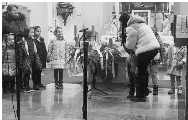
Dózsa György utcai óvoda