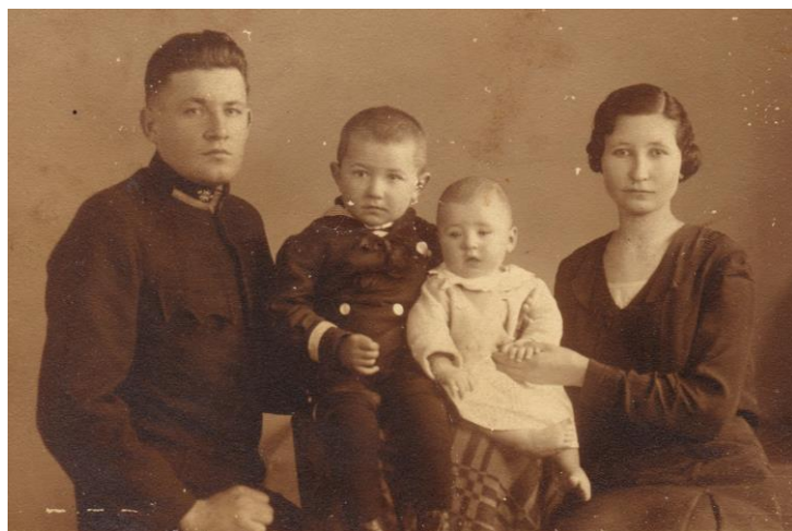
Szüleivel és bátyjával 1938. Jól látszik láb problémája.

1. Az értéktárba felvételre javasolt nemzeti érték fényképe vagy audiovizuális-dokumentációja: