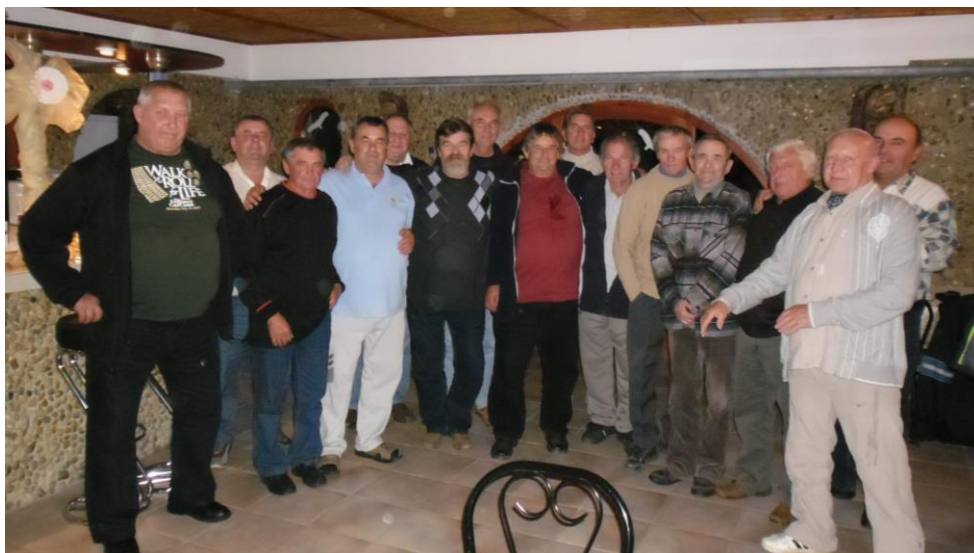
„A csapat. „, Nosztalgia találkozó