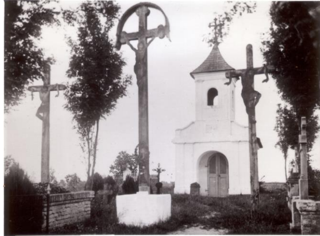
Kripták, sírok a temetőben. 4 db kép Bárkányi Ildikó készítette 2014-es felvételek.