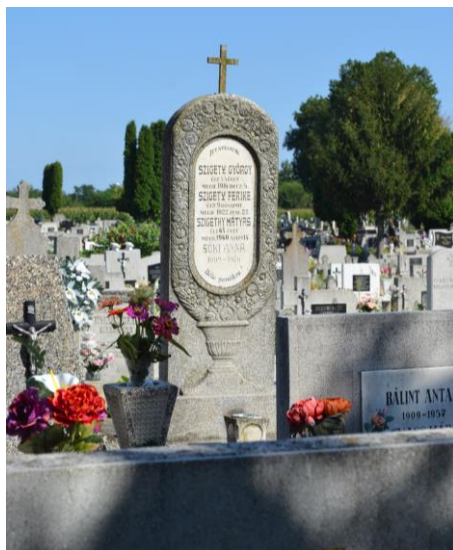
Vargané Nagyfalusi Ilona felvételei 2016-ban, 4 db kép.