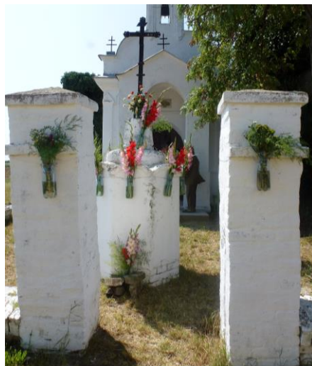
Langó-kápolna előtti kereszt