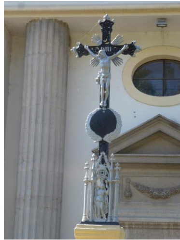
Templom előtti kereszt