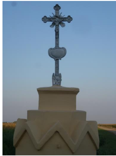
Kardos Noé féle kereszt

A 2. kép a Langó kápolna előtti kereszt 2019.