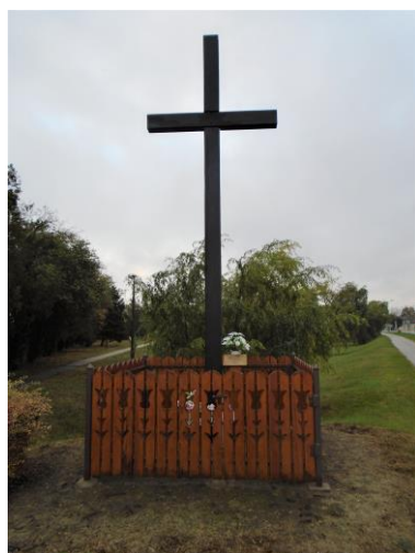
Szent Anna kereszt 2019