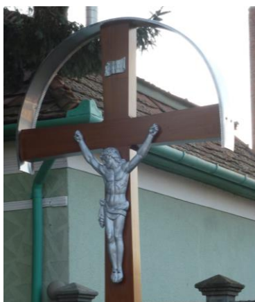
Templom utca Kölcsey utca kereszteződésében levő kereszt 2016. 05.