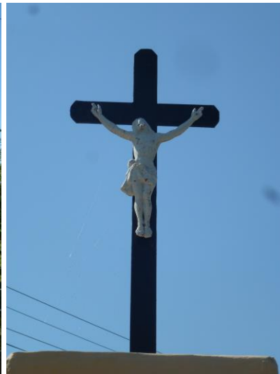
Széchenyi utca elején levő kereszt