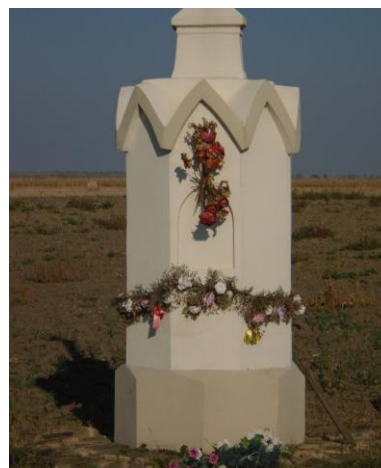
Kiss Lajos féle kereszt vagy Csikota kereszt, 3. kép 2019